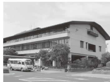
▲市役所津屋崎庁舎

土地・建物や株式を売った人 配当や先物取引があった人 これらの損失を繰り返す人 ご注意ください!