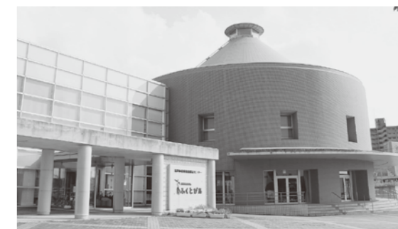
▲ふくとびあ健康プラザで受け付け