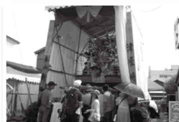
▲津屋崎で山笠探訪