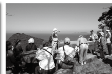
▲大峰山・東郷公園を歩こう