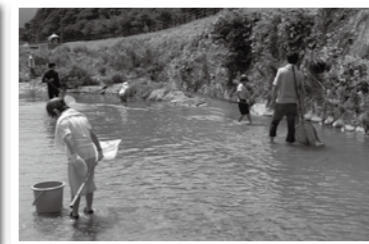
▲西郷川で生き物観察

この他にも、健康・福祉やスポーツ、国際交流の分野など年間100講座以上行っています。