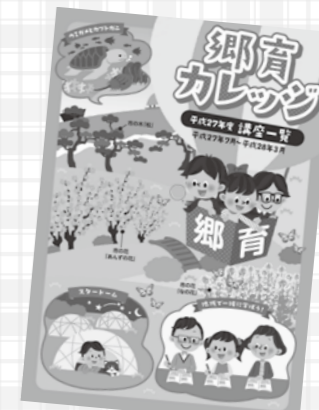
▲郷育カレッジ 講座一覧