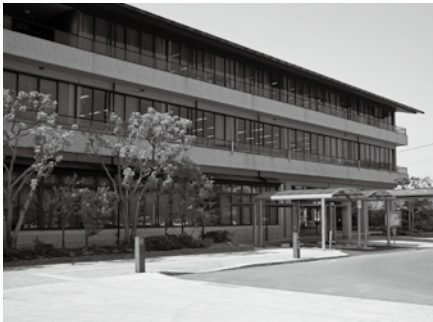
▲6月に、市役所が福岡庁舎に統合されます