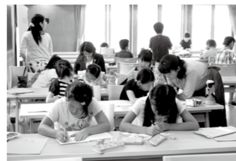
▲「南しょとセンター」での寺子屋の様子

福津市いきいき健康課健康づくり係(ふくとびあ) ☎34・3351 メール fukutopia@city.fukutsu.lg.jp