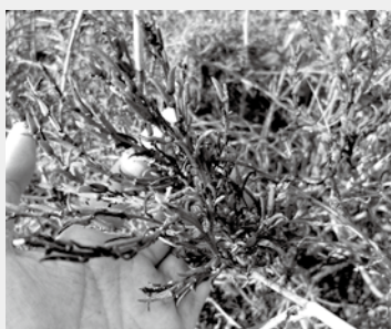
▲みごとな紅葉が見られます

秋の干潟では、ハマツナ（浜松菜）という珍しい植物の紅葉が見られるほか、多くの渡り鳥も観察できます。保全活動を行う「干潟みまもり隊」が観察会のお手伝いをしますので、御参加ください。