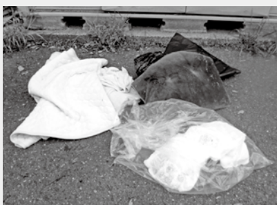
▲布団や紙おむつは出さないでください

市中央公民館の駐車場に古紙・古着回収倉庫を設置しています。ここでは、新聞やチラシ、段ボール、雑紙（雑誌、菓子箱など）、古着を受け入れています。皆さんの御協力で、平成27年度は301トンの古紙や古着を回収することができました。しかし、利用にあたって