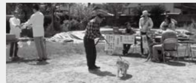
▲昨年の緑町公民館での注射の様子