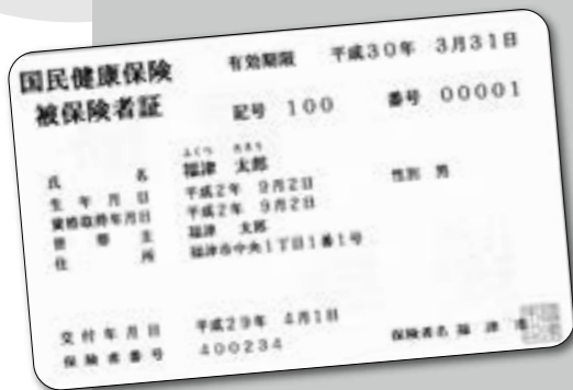
▲保険証は原則、一人1枚です

国民健康保険の加入や脱退の届出は14日以内に 福津市国民健康保険に加入 するときは、加入前の保険資 格を喪失してから14日以内に