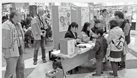
▲昨年度の環境フォーラムの様子

受付方法 住所、氏名、年齢、電話番号、託児の有無を記入し、はがき、ファクス、メールなどで市うみがめ課までお申し込みください。 ※第1回会議は、6月下旬の予定です。受付期限後、郵送でお知らせします。