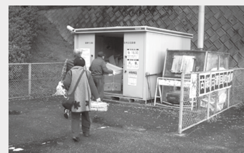
▲回収倉庫には多くの古紙や古着が持ち込まれます

古紙・古着回収倉庫の開設日を平成30年4月から次のとおりに変更しました。 開設日 毎週火曜～金曜日 ※祝日、8月13日(月)～8月15日(水)、12月28日(金)～平成31年1月4日(金)を除く ※月曜日が祝日の場合は、翌日の火曜日にも休みになります。日程は左の表をご覧ください