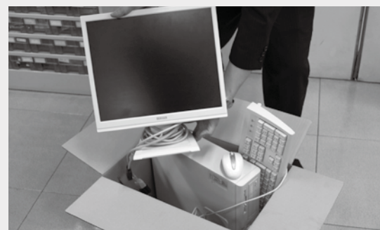
▲パソコンを段ボールに梱包します

花見の里海岸の松林保全活動が福間郷づくり会の主催で3月13日に開催されました。今回は福間中学校の1年生約200人が授業終了後に参加し、枯れ葉や枯れ枝を集めて、松林をきれいに清掃しました。生徒や集まった皆さんの協力により、集まったゴミは大きなゴミ袋10袋以上になりました。きれいになった地面からは新芽が出ることでしょう。松林とともに今回参加した生徒たちの成長が楽しみです。【徳永孝志さん】