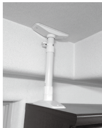
▲突っ張り棒で、家具の転倒防止

室内にいるときに地震が発生した場合、家具類の転倒や収納している物の落下によるけがに気をつけましょう。もしもの災害に室内の備えはできていますか。物は納戸やクローゼットのような据え付けの家具に収納するようにしましょう。ダンスなどの家具を置く場合は、家具が倒れたときに自身や家族が下敷きにならないこと、ドアや避難経路をふさがないことに注意して配置を工夫しましょう。家具は、L型金具などで壁にネジ止めするか、突っ張り棒、粘着マットなどを組み合わせてしっかりと固定しましょう。