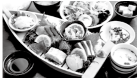
▲旬の刺し身が堪能できる船盛御膳 問い合わせ 福津いいざい ☎72・6333

今回紹介するのは、お魚センター2階の「空と海」。おすすめ料理の船盛御膳のほか、福津で水揚げされた魚料理を堪能できます。