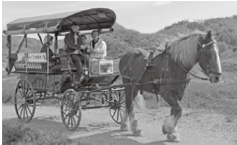
▲馬車の乗車は午後1時から