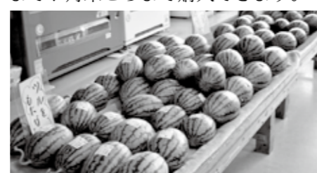
▲ふれあい広場ふくまで販売中です

福津の特産品である中身が黄色の「クリームスイカ」の販売が、今年も始まりました。スイカ農家が厳しい基準を大切に守り、丹精込めて育てています。味はさっぱりと、上品で、赤玉スイカともまた違う独特の味わいが楽しめます。ふれあい広場ふくまで7月末ごろまで購入できます。