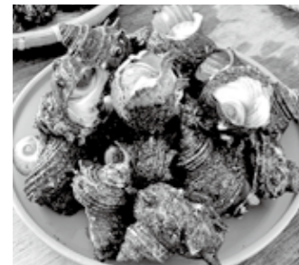
▲新鮮で生きのいいサザエ

福津こつね 「福津のやねまこ」を開催 サザエの特売会のほか、サザエ飯、つば焼き、漁師が教える「ウニ割り体験」などを用意しています。皆さんの参加をお待ちしています。 日時 7月28日(日) 午前11時～ 場所 あんずの里市 問い合わせ あんずの里市 利用組合 ☎52・5995