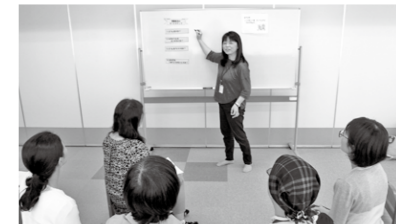
▲子育てについて多くのことを学べます

子育てについて話しませんか ノーバディーズ・パーフェクトとは「完璧な親なんていない」という意味で、カナダ生まれの親を支援するプログラムです。子育ての楽しみや悩みをみんなでお話し合い、自分にあった子育ての仕方を学べる参加者中心の学習スタイルです。専門知識を持ったスタッフ