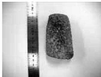
▲手光酒屋遺跡出土の石斧

写真は、樹木の伐採に用いる石斧の破片で、表面に現れた風化による凹凸感が特徴的です。この種の石斧は豊前地域を中心に福岡・大分・山口に出土例があり、北九州市では製作工房も発見されています。福津へは交易によってもたらされたのでしょうか。写真の石斧は、弥生時代の流通の一端を垣間見ることができる資料です。