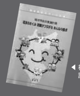
福津市食育推進計画