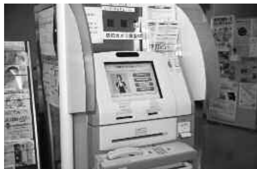
▲ふくとびあにある証明書自動交付機。利用時間などは設置場所により異なります

「住民基本台帳カード・ふくつ市民カード」があれば、「証明書自動交付機」により、市役所閉庁時でも住民票の写しや印鑑登録証明書・所得証明書などをとることが出来ます。 ●カードを作るには? 市民課市民係(福間庁舎)で申請が必要ですが、申請に必要なもの 認め印・写真付き本人確認書類(運転免許証・パスポートなど)・手数料五百円、写真付き住基カードを希望する人はパスポートサイズの写真(縦四・五センチ×横三・五センチ) なお、写真付きの本人確認書類を持っていない人は、郵送による本人照会を行いますので、後日、市役所から郵送された照会文書を持って再度