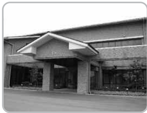
▲福岡浄化センター

このような下水道処理施設を使うことによって、生活環境を改善し、川や海の水質・自然を守ることができます。