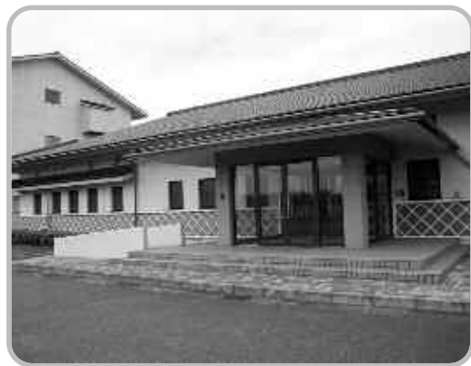
▲津屋崎浄化センター

市には公共下水道の浄化センターとして、「津屋崎浄化センター」「福岡浄化センター」および「東部終末処理場」の三か所があります。そのほか、汚水処理施設として、若木台と西福岡間に地域し尿処理施設があります。また、住宅団地などで、集中浄化槽によって、限定したエリアを対象に下水処理を行っている所もあります。