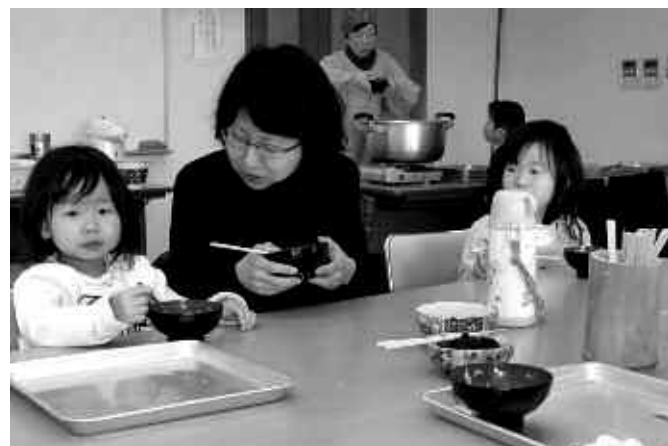
▲小さな子どもたちもおもしろそうに食べていました

〒811-3293 (住所不要) 福津市役所広報秘書課 広報ふくつ行 ☎43・8113