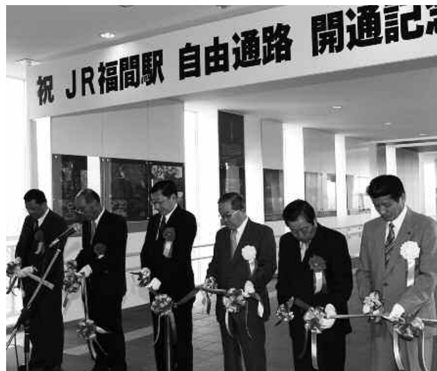
▲開通を記念して、テープカットをする市長(右から3人目)たち