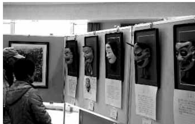
▲見事な能面の作品

2月4日から3日間ふくとびあで、「歩こう会」発足20周年を 記念して、会員の趣味の作品展が開催されました。陶芸や写 真、絵画、書、彫刻、手工芸などの作品が数多く展示され、訪 れた人は、会員の見事な作品をじっくりと観賞していました。「福 津市歩こう会」は、歩くことでの健康づくりと仲間づくりを目的に活 動し、地域の活性化にも大きく貢献しています。