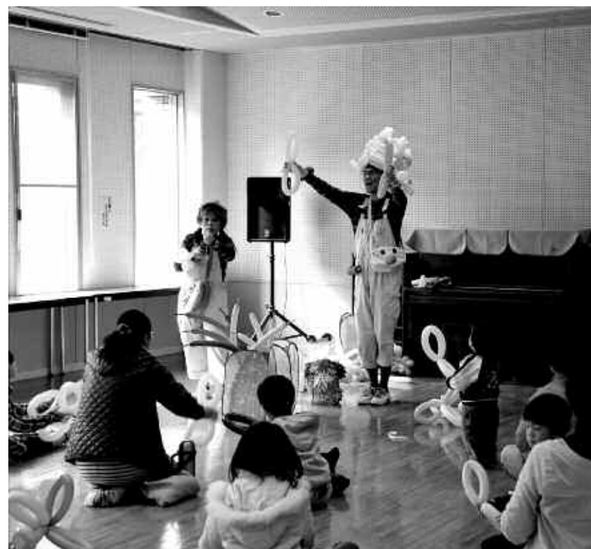
▲風船がいろいろな形に様変わり