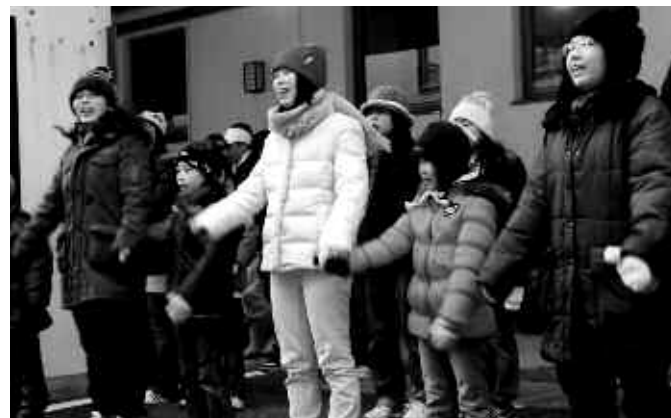
▲津屋崎少年少女合唱団の美しいハーモニーが響き渡りました

12月31日悪天候の中、年の瀬恒例の「結びの夕陽」が行われ、津屋崎海岸に沈む夕日を見ようと約200人が集まりました。残念ながら夕日を見ることはできませんでしたが、津屋崎少年少女合唱団の歌声や津屋崎郷づくり活性化部会の手作りそばが、皆さんを温めてくれました。午後5時17分にカウントダウンをして、今年の結びとなりました。