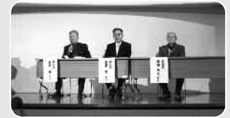
「ふくつ言いたか放題」では、教科書には載っていない「昔の福津の生活」の話をたくさん聞かせてもらいました。