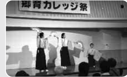
勝浦小アンビシャス剣詩舞会の皆さんが見事な剣舞を披露