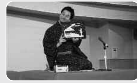
そこつやよいしよ 粗忽家酔書さんの落語と紙切りは会場を笑顔いっぱいにしました