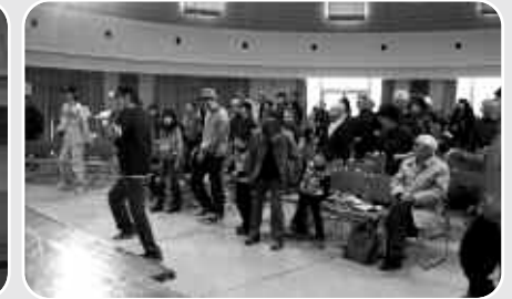
参加者全員で一緒にヒップホップダンスを踊りました!