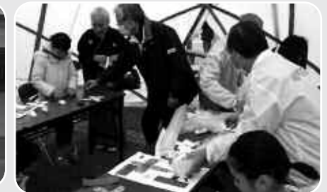
JAXAのペーパークラフトやカサ袋ロケットを作って飛ばしました

皆さんにとって、新しい「出会い」「ふれあい」「学びあい」が見つけられたことでしょう。