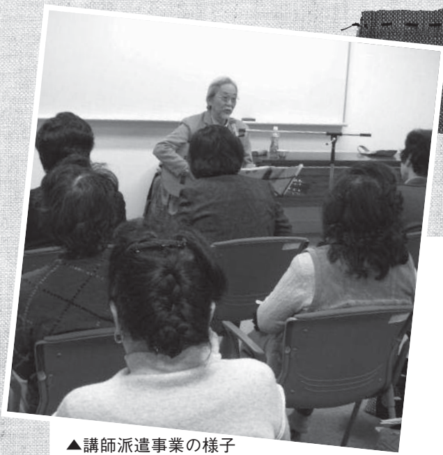
▲講師派遣事業の様子