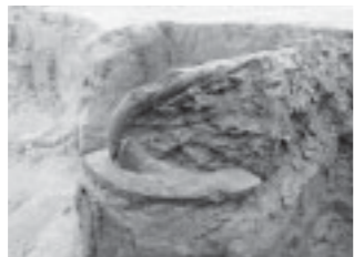
▲木製品の出土状況

現時点で調べた範囲では類例はなく、はっきりと用途を確定させることはできません。ただし、柄の形状に着目すれば、木材の面を整える大工道具である「手斧 ちような 」と似ていることから、石斧を板に巻き付けたり、板の先端に鉄斧を差し込むなどして、斧の柄として使用された可能性があるのではないかと考えています。