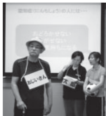
▲認知症サポーター養成講座での寸劇の様子

この「蓮華草」では、現在、一緒に活動していただける方を募集しています。特に資格や経験などは必要ありません。興味のある方は、問い合わせください。