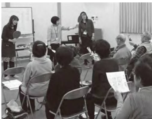
▲楽器を演奏する参加者(光陽台公民館)