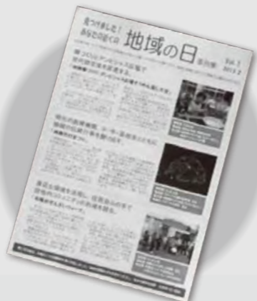
▲これまでに市広報などで紹介した活動事例をチラシにまとめて、市内公共施設に配布していますので、ぜひご覧ください

『地域の日』って?..... 市では、住民の皆さんが地域のことを考え、参加するきっかけとするため、奇数月の第3土曜日・翌日曜日を『地域の日』と定めています。