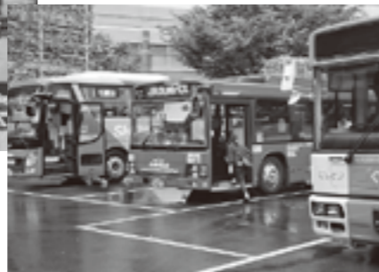
▲ギャラリーバスの展示

県と県内全市町村では、10月20日(日)までのキャンペーン期間中、路線バスの利用促進に取り組んでいます。