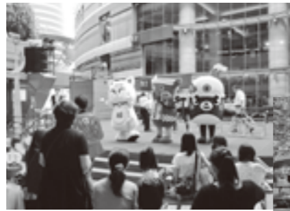
◀会場を盛り上げたゆるキャラたち