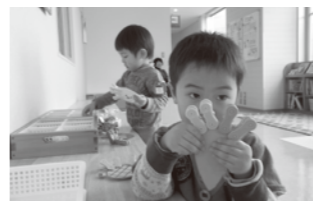
▲好きな遊び見つけたよ! アイクリップ