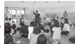
▲傘だって素敵なおもちゃ!