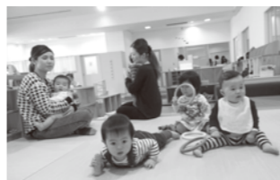
▲はいはいコーナーのお友達

木のおもちゃや手作りおもちゃ、絵本などを用意しています。 すべり台や積木遊びなどもできます。親子で楽しく遊びましょう。