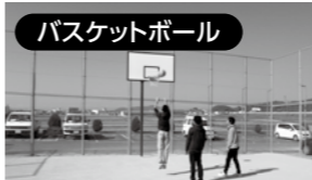
バスケットボール シュートが決まると気持ちがいいです。