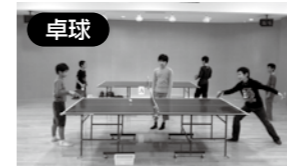
卓球 気軽にできて楽しいです。汗をかいて燃えます。