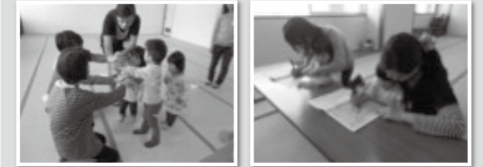
親子でたくさん触れ合いましょ