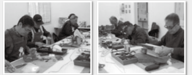
おもちゃ病院の先生たちが、一生懸命診てくれます