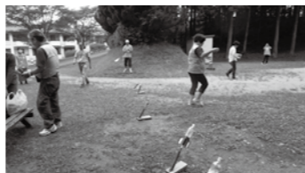
▲作ったペットボトルロケットで飛行実験