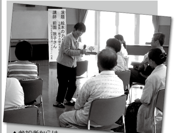
▲参加者からは、楽しい時間を過ごせたとの感想が多数ありました

市では、平成15年9月20日に「男女共同参画都市」を宣言したことにちなみ、9月を福津市の男女共同参画を推進する月と定め、毎年、記念事業を行っています。