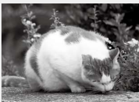
▲餌付けは他人の迷惑になります

発情期になると、昼夜を問わず独特な鳴き声を出します。これらの猫の行為は、猫が好きの人にとっては容認できるものかもしれませんが、迷惑に感じている人もいます。