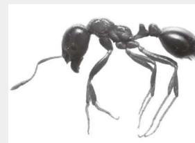
▲ヒアリには強い毒性があります

やけどのように熱く激しい痛みが生じます。万が一刺されたときは、安静にしましょう。また、アレルギー症状が重篤な場合は、呼吸困難や血圧低下、意識障害などを引き起こすことがあります。少しでも異変を感じたり、容態が回復しなかつたりする場合には、速やかに最寄りの病院を受診してください。