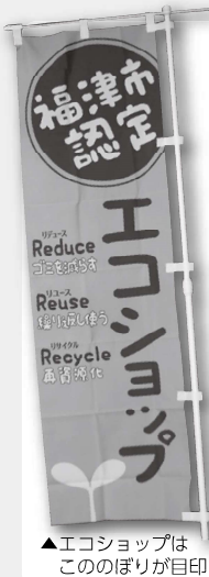
▲エコショップはこのぼりが目印