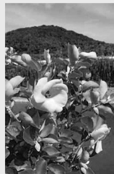
▲黄色いハマボウの花

夏の津屋崎干潟では、和製ハイビスカスと呼ばれるハマボウが見事な黄色い花を咲かせます。干潟には他にも貝やカニの仲間など、多くの生き物を観察することができます。当日は、干潟みまもり隊が観察会のサポートをします。 日時 7月14日(土) 午後1時30分～午後3時30分 ※少雨決行 集合場所 市役所本館正面玄関前 午後1時15分から受付開始 ※当日は、津屋崎方面を経由して干潟まで行く無料バスが出ます。 参加費 無料 持参品 長靴、軍手、汚れてもいい服装 定員 先着20人程度 受付期限 7月2日(月) 受付方法 期限までにファクス、電話、メールで申し込みください ※ファクス、メールの場合は、送信後に確認の電話をお願いします。