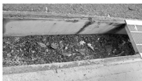
▲側溝は定期的に清掃しましょう