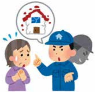
▲不審に思ったらすぐに相談を

もしお金の話を持ちかけられたら、1人で判断することなく、落ち着いて市役所や警察などの公的機関に確認したり、家族、知り合いに相談したりすることを心掛けましょう。