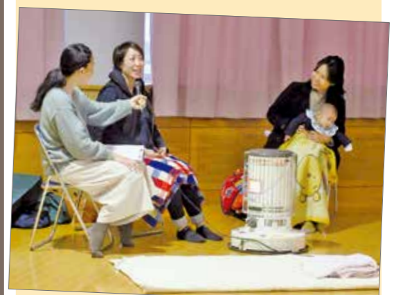
▲妊娠中の女性へのインタビュー。この後、おなかの赤ちゃんの心音も聞かせていただきました

性別に関わらず、一人一人が輝ける社会を目指す福津市。このコーナーでは、市や市民の「男女がともに歩む」取り組みを紹介しています。