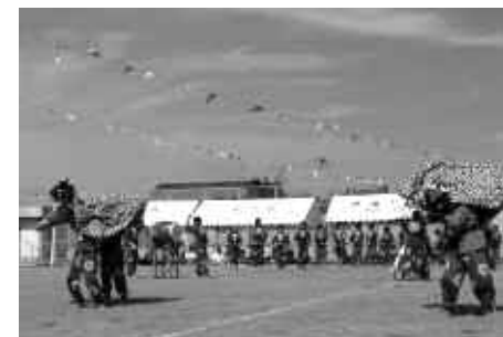
獅子楽の太鼓音が芝生の運動場に響き渡る運動会での発表会