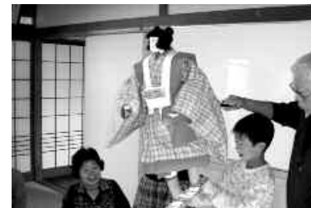
地域の人に人形浄瑠璃を指導してもらっている勝浦小の児童