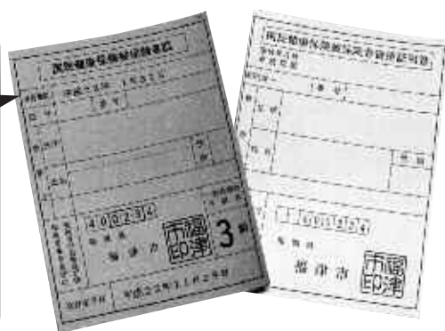
▲短期被保険者証(左)・資格証明書(右)

国民健康保険制度では、被保険者に一般的に交付される国民健康保険者証のほかに、短期期限付被保険者証(以下「短期被保険者証」という。)および被保険者資格証明書(以下「資格証明書」という。)があります。 短期被保険者証および資格証明書は、国民健康保険税を滞納している被保険者に対して交付されるものです。 短期被保険者証は3か月以内の短期間に有効期限を区切れられ、定期的な更新の手続きが必要となることを除いては国民健康保険被保険者証と同じように使うことができます。しかしながら、短期被保険者証は期限が切れると医療機関で使うことができなくなりますので、早