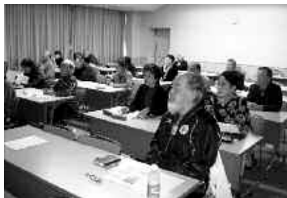
▶講師の話に引き込まれている受講者の皆さん