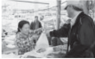
▲津屋崎漁港で海産物を売る様子