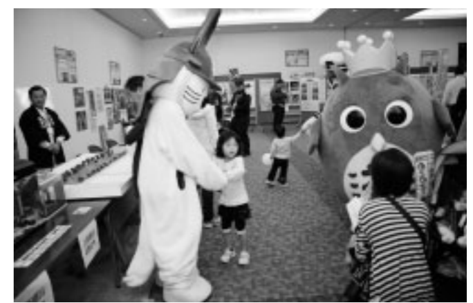
▲ゆるキャラと遊ぶ子どもたち

イオンモール福津がランドオープンした4月26日から30日までの5日間、市はイオンの来場者に福津の魅力を発信するため、イオンモール福津2階の特設会場で「ふくつステーション」を開催しました。干潟の生き物と触れ合えるタッチプールや糸まり作り講座、子ども司書のお話会などさまざまなイベントで、福津の魅力をアピール。5日間で約2000人の来場者がありました。