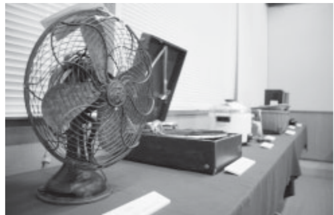
▲味わいのある形の扇風機

展示会場には昔の扇風機や炊飯器、糸車などが多数展示されていました。こんな素敵な古道具を眺めていると、オブジェとして部屋に飾りたくなります。