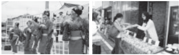
▲津屋崎漁港でのステージイベント