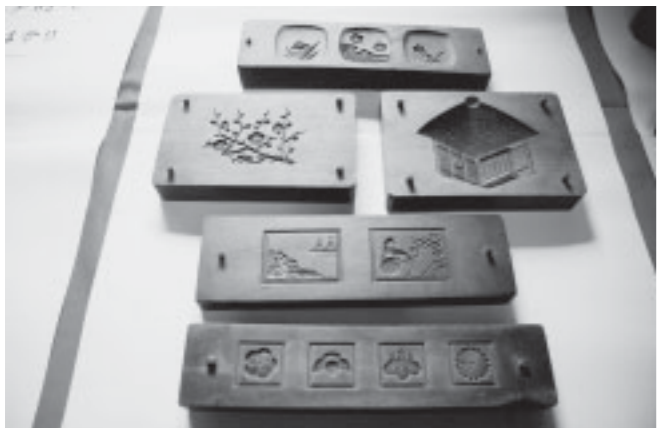
▲今ではほとんど見る事が出来なくなった落雁の型