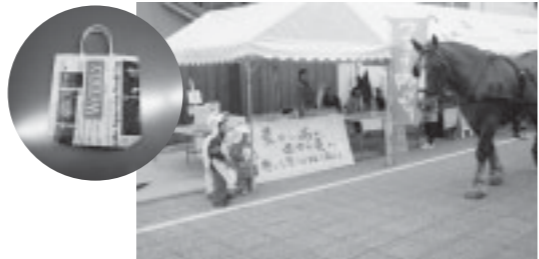
▲新聞紙のバッグを売って、東日本に寄付