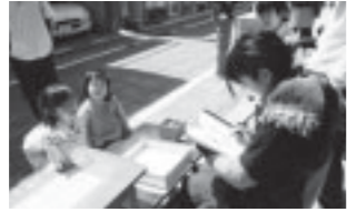
▲古民家前で似顔絵を描く女性