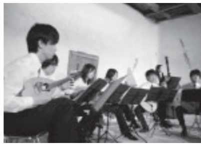
◀酒蔵のカフェでマンドリンコンサート