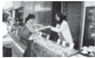
▲千軒通りに雑貨屋さんが並びました