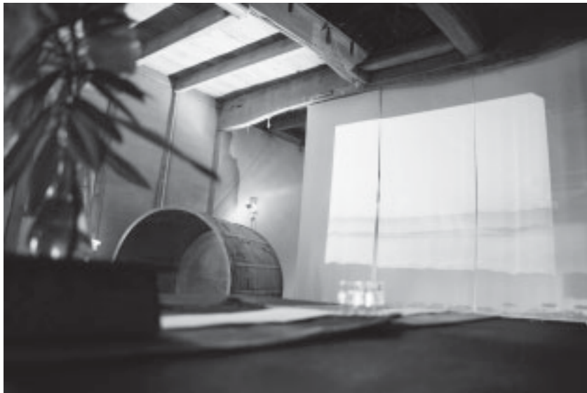
▲酒蔵を利用したカフェ。波が打ち寄せる「ザザー」という音と海岸の映像で、海辺の空間を演出

地域の人たちによる手づくりの「よっちゃん祭」は、人と人との交流とたくさんの笑顔に包まれた祭りとなりました。