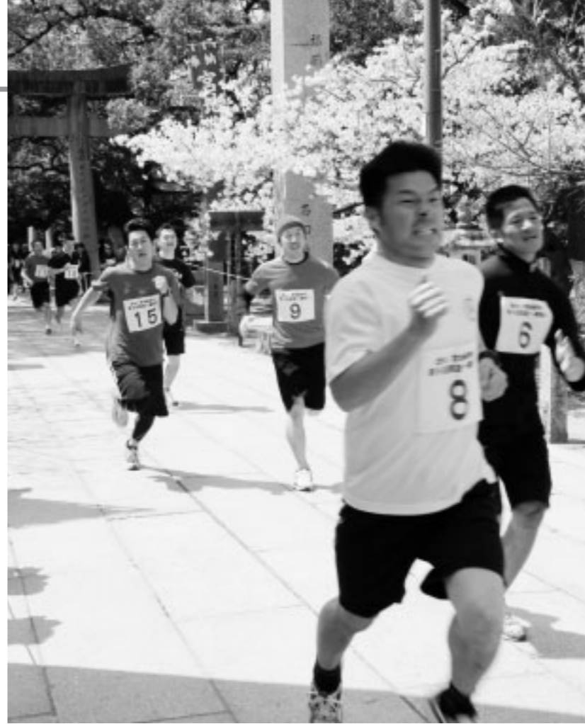
▲参道270メートルを駆け抜ける