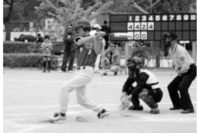
▲どの選手も真剣にプレーしていました

5月13日に「第8回福津市成人(300歳)ソフトボール大会」が、市内の運動公園の「なまずの郷・あんずの里・みずがめの郷」の3会場で開催されました。 チームの合計年齢が300歳を超えなければならないというルールで、約60チームが白球を追って熱戦を繰り広げました。 選手の好プレーに応援席も大いに盛り上がっていました。