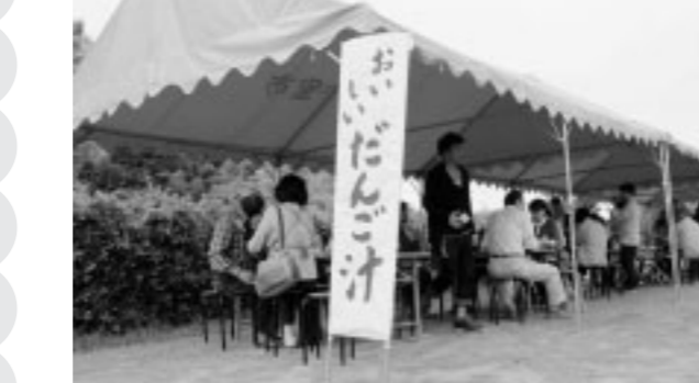
▲多くの人々が「だんご汁」に舌鼓

5月3日、生産者直売所「あんずの里市」で誕生祭が開催されました。 新鮮な野菜や果物などがずらりと並ぶ会場では、チャリティーだんご汁が振る舞われたり、餅つき体験や販売が行われたりして、多くの人たちで賑わいました。