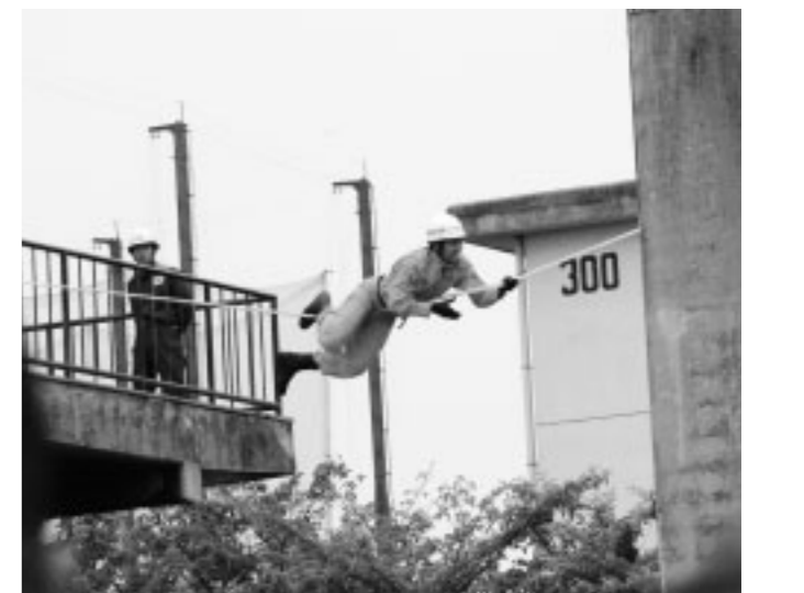
▲忍者のようにスルスルとロープを渡る隊員

5月30日、西福岡にある県消防学校で「福岡県消防救助技術大会」が開催されました。 県内の消防本部から440人の隊員が出場。建物と建物の間に掛けられたロープを渡ったり、背丈の2倍はあろうかという壁を乗り越えたりと、鍛え抜かれた救助技術を競いました。