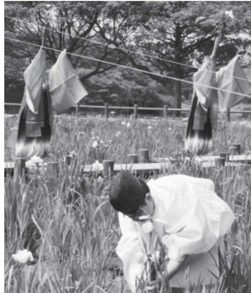
▲神職が菖蒲を刈り、巫女が艶やかに舞う