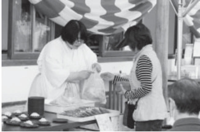
▲薬草茶とよもぎ蒸しパンが振る舞われました