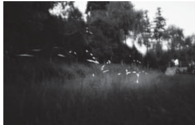
▲ホタルは午後8時～9時に掛けて乱舞する

6月2日・3日の2日間、ほたるの里で「ほたるまつり」が開催されました。今年、コンサートやスタンプラリーを楽しむことができました。300食の豚汁が無料で振る舞われ、長蛇の列ができていました。日も暮れた午後8時からは水辺にホタルが乱舞していました。訪れた人たちは、幻想的な光に歓声を上げながら、初夏の風物詩を楽しみました。