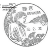
「鎌倉郵便局の風景日附印」