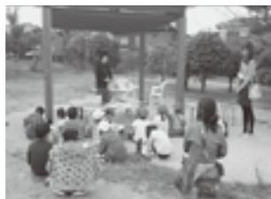
▲まちの宝探しで訪れた福間小2年生