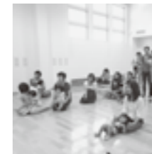
知りたいから真剣!

「トイレトレーニング」「離乳食」「生活と絵本」をテーマにアンケートに寄せられた「知りたいこと」を一つ一つ解決しました。話すことで「子育て大変なのはみんな一緒!」と安心をしたり、子育てステップにつながったり、楽しい学習会を持つことができました。