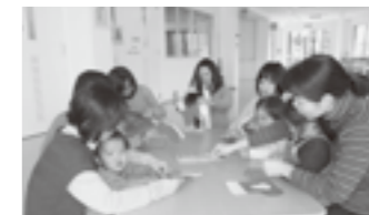
12月「サンタブーツ」のひも通し

2歳以上の親子が元気に遊ぶ「ともだちタイム」 「汗をかきまで元気に遊ぼう」「順番やルールを守って遊ぼう」をテーマに、しっかり体を動かして遊んだり、季節の行事に合わせて、たこやおひなさまなどを作ったりして、親子で遊んで交流しています。体をしっかり使って遊んだ後は、子どもたちの満足気な笑顔がいっぱいです。