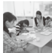
みんなで食べるとおいしいね