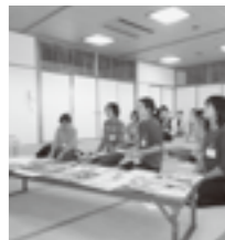
たくさんの絵本に出会いました