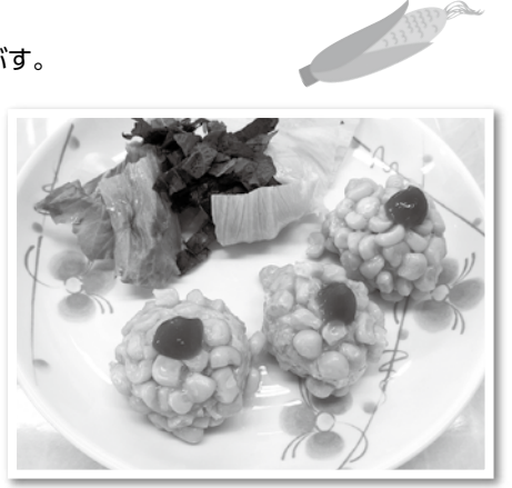
レシピ提供: 福津市食生活改善推進会