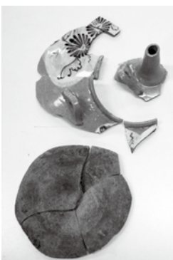
▲出土した陶器の土瓶

出土した土瓶は、必ずしも胎 衣容器とは断言できませんが、 何らかの祈りを込めて埋められ たと考えられます。