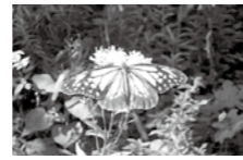
▲昨年飛来したアサギマダラ

わかたけ広場は自然の宝庫。遠くの地から飛来するアサギマダラを見つけてみましょう。チョウや草花からのメッセージに耳を傾けてみませんか。