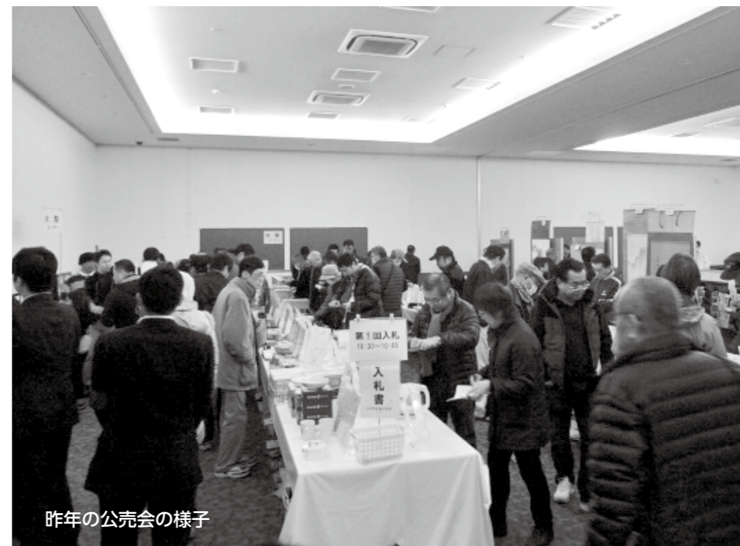
昨年の公売会の様子

税金は納期限内納付が大原則! 今後も納期限内納付へのご協力をよろしくお願いいたします。