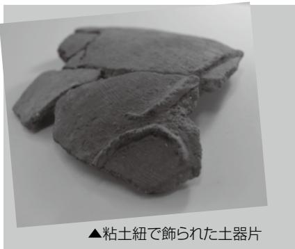
▲粘土紐で飾られた土器片

昨年度に発掘調査した井尻遺跡第6地点（花見が丘三丁目）の出土遺物の中から、少し変わった装飾の弥生土器が見つかりました。写真は、米の煮炊きに使われる甕形土器の胴部の破片です。土器右手側（手前）の欠損部分に外開きの口が付くと推定され、その欠損部分に接して粘土紐を貼り付けています。口のやや下方に粘土紐をぐるりと巡らせたのでしょう。粘土紐の貼り付け自体は一般的な装飾なのですが、この資料はその貼り付け方が特徴的です。通常、粘土紐のつなぎ目はきれいに消されますが、この土器の場合はあえてつなげず、それぞれが緩い弧を描いて互い違いに貼り付いています。この特徴以外に他の土器と変わった様子はなく、特別な用途に使われたとも思えません。何かの目印だったのか、それとも土器製作者の気まぐれなのか。類例はごくまれにあるようで、それらには共通した意味があったのでしょうか。いろいろと想像が膨らむ資料です。