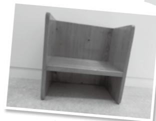
▲これは何でしょう

子育て支援センターでは、育児講座「箱型いす作り」を行っています。日頃めったに子育て支援センターでは、上の写真、何だか分かりませんか。どのように使うのでしょうか。正解は「子ども用木製箱型いす」です。座る部分の板が真ん中についておらず、向きを変えると高さが変わるので、身長やテーブルの高さに合わせて使える優れものです。また、絵本棚や踏み台にもなり、工夫しだいでさまざまな用途で長く使うことができます。