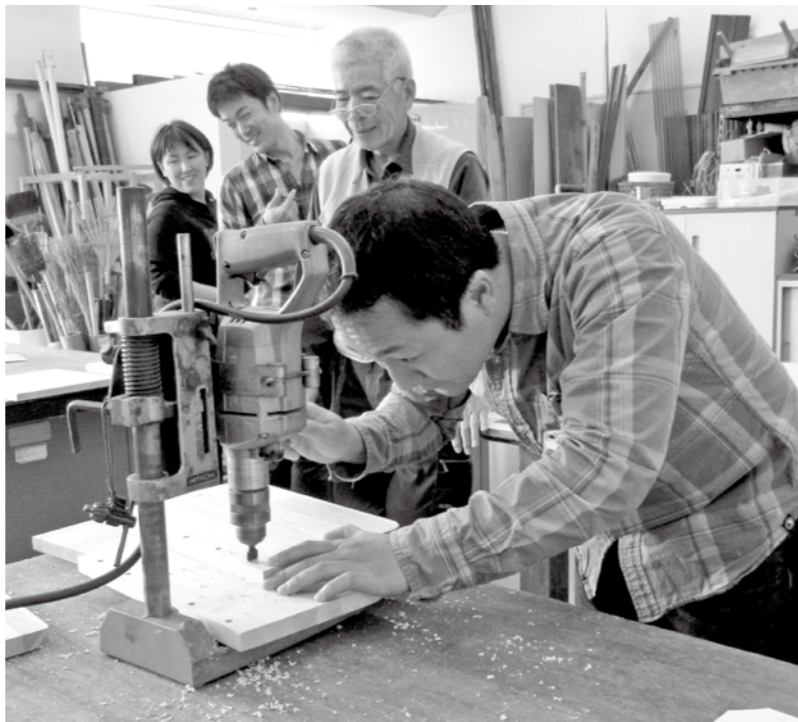
▲昨年度の箱型いす作りの様子

※着替え、タオル、お茶、帽子を必ず持参ください。 ※ひがしふくま真愛保育園には駐車場がありません。車での参加は御遠慮ください。