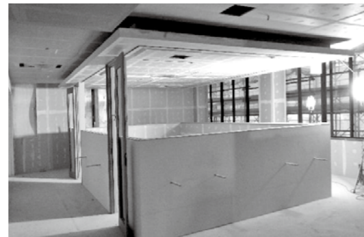
▲完成間近の学習室