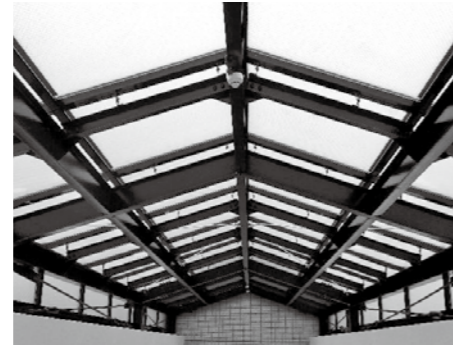
▲中庭上空にトップライト設置

歴史資料館では、市中央公民館と旧津屋崎庁舎3階にあった歴史資料室を統合し、市に関する史料を集約します。