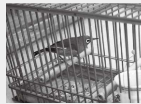
▲警察に押収されたメジロ

県では、平成24年4月1日からメジロの愛玩目的の捕獲を許可していません。また、自治体の飼養登録を