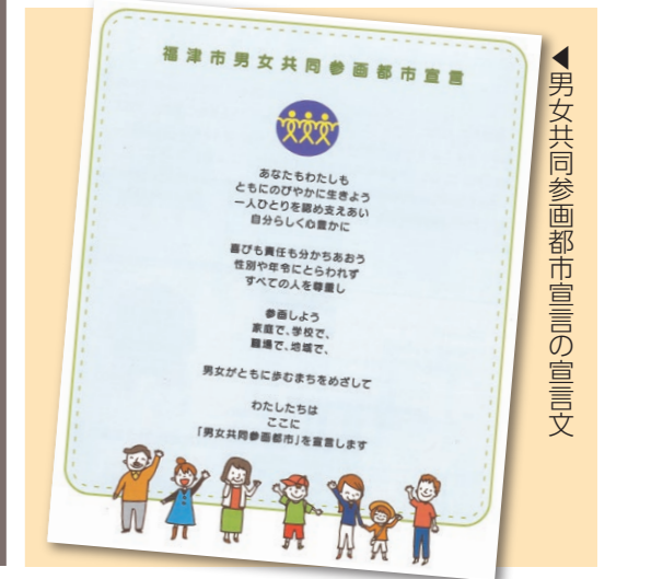
男女共同参画都市宣言の宣言文

性別に関わらず、一人一人が輝ける社会を目指す福津市。このコーナーでは、市や市民の「男女がともに歩む」取り組みを紹介します。