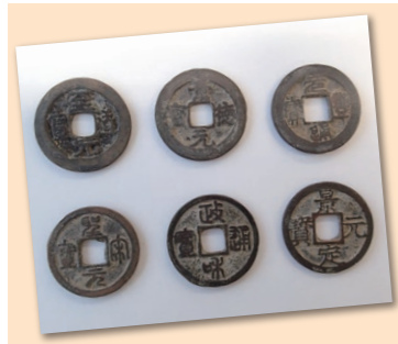
▲見せていただいた古銭の一部

市内在住の方から、昭和30年頃に練原の積内池の工事で見つかったという、昔のお金を見せていただく機会がありました。1枚は江戸時代終わり頃に日本で、その他は10世紀から13世紀に中国の宋で作られたものでした。日本では、平安時代から江戸時代が始まるまで、中国などから大量に輸入した渡来銭を使っていました。中世の練原でも、この渡来銭が流通していたことが分かります。お金が見つかった積内池の近くでは鎌倉時代の遺跡が発掘調査され、中国から輸入された青磁、建物や鍛冶炉などがみつかっています。このお金の持ち主も、これらの遺跡で生活していた人かもしれません。