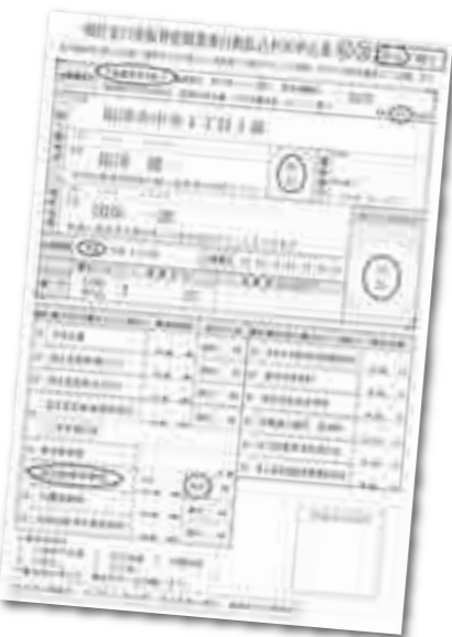
▲市共通の口座振替申込書。市役所や金融機関で受け付けます

国民健康保険税を納める方法は、年金天引きによる特別徴収と納付書または口座振替による普通徴収があります。普通徴収では、納付書も口座振替も納付する額は同じですが、口座振替にすると、金融機関などに支払いに行く手間がなく、納め忘れの心配がありません。また、保険税の変更で還付金が生じたときには、同じ口座を利用するため、還付までの期間が短くなります。