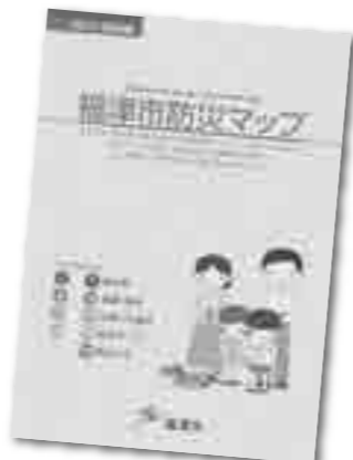
▲市公式ホームページから閲覧できます

災害が起きたときの避難場所を知っていますか。避難場所への移動は、どの道を通るのが安全でしょうか。行く途中に、川や崖など災害時に危険となるようなところはありませんか。市防災マップなどで、自宅の周囲の地形や地質、危険な場所、過去に起きた災害などを、知って、災害へ備えましょう。また避難場所となる公園や公民館、学校などに実際に歩いてみて、ルートや危険な場所を確認しておくことも大切です。家庭でオリジナルの防災マップを作って、家族で情報を共有するのもおすすめです。