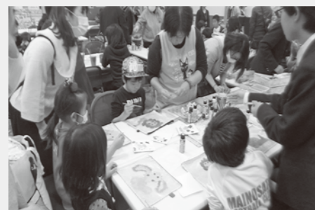
▲体験イベントを楽しむ参加者

市では、皆さんとともに環境について考える場や環境保全活動をしている皆さんの発表、交流の場として、環境フォーラムを毎年開催しています。開催に当たっては、毎年、企画運営委員会を立ちあげ、市民と行政との『共働』で内容を企画、運営しています。