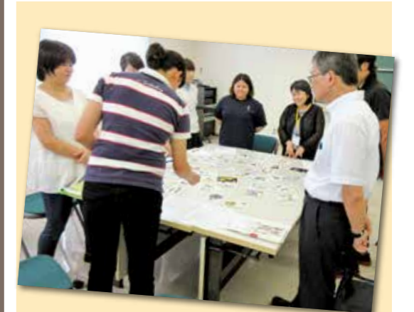
▲男女共同参画カルタにチャレンジする参加者の皆さん

性別に関わらず、一人一人が輝ける社会を目指す福津市。このコーナーでは、市や市民の「男女がともに歩む」取り組みを紹介します。