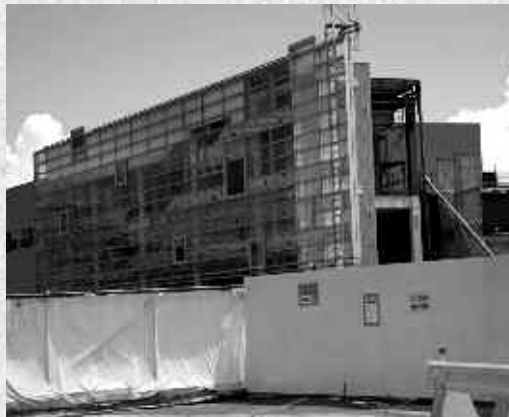
▲西口駅前広場は博多側を工事中