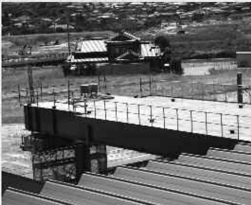
▲工事中の自由通路

現在青空駐輪場となっている博多側の駐輪場が、立体駐輪場に生まれ変わります。工事開始に伴い、8月29日に現在の駐輪場の駅側半分を閉鎖しました。立体駐輪場の完成まで、左図の通り2か所の臨時駐輪場を設置します。