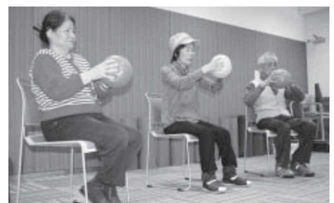
▲らくらく快福運動教室の様子

男性が参加した教室は、「らくらく快福運動教室」。65歳以上の(要介護認定者を除く)の誕生日に郵送している「高齢者いきいきチェックリスト」で、足腰が弱っているサインが見つかった人を対象としています。教室の前には職員が会って、体調や体の動きを確認。理学療法士などのリハビリ専門職員と健康運動指導士などの運動療