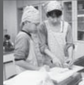
▲親子クッキングの様子