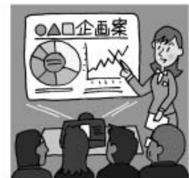
▲男女共同参画は事業所においても求められています。

が必須となっています。具体的な項目としては、従業員の男女別人数、育児・介護休業などの利用状況、就業しながら育児・介護ができるような事業所の取り組み、セクハラ防止対策などがあります。また、福岡県子育て応援宣言登録をしているかという項目に基づき、登録している業者のみを対象とした制限付一般競争入札も実施しています。 この報告内容は、全登録業者の回答を集計して、ホームページなどで公表しています。平成20年度と平成22年度のデータを比較しますと、「短時間勤務の制度を実施している」は50.6%が56.8%に、「職業家庭両立推進者の選任」は14.5%が18.5%に、「セクハラ防止に関する研修を実施している」は27.5%が30.7%に上昇するなど、多くの項目で、実施率が上昇しています。 まだまだ低い数字であることは否めませんが、市では事業所などと協力しながら、これからも事業所における男女共同参画を啓発していきます。