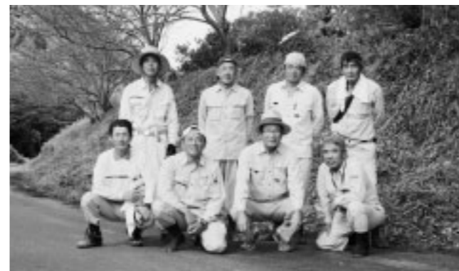
▲福津市造園連絡協議会の8人