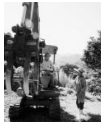
▲パワーショベルも登場。作業が進む