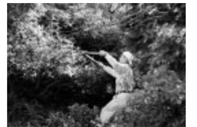
▲剪定ばさみで、ツツジの枝を刈り込む