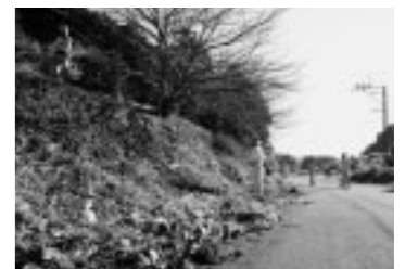
▲麓の美しくなった様子