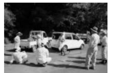
▲作業を終えて一服