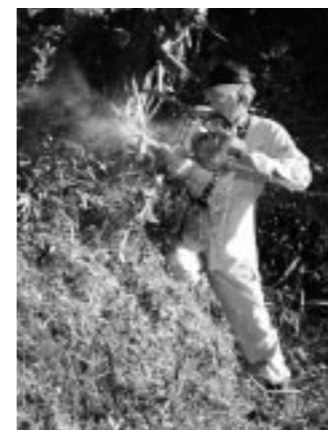
▲チェーンソーで大木も伐採