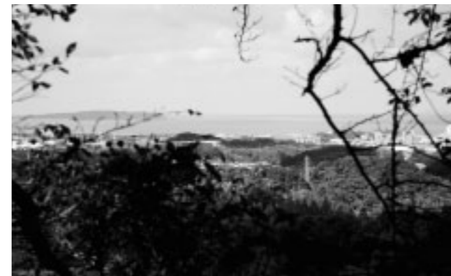
▲山頂には草が繁茂しているため登ることはできない。藪をかき分け山頂まで登ると海まで眺望できる絶景スポットになるだろう