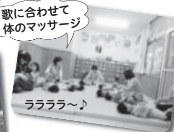
歌に合わせて体のマッサージ