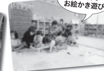
広い紙でお絵かき遊び