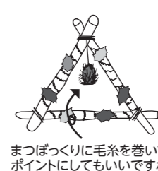
まつぼっくりに毛糸を巻いてポイントにしてもいいですね。