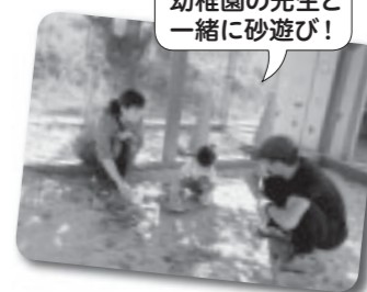
幼稚園の先生と一緒に砂遊び!