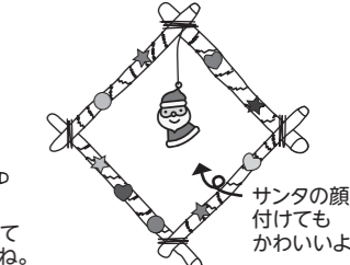
サンタの顔を付けてもかわいいよ。