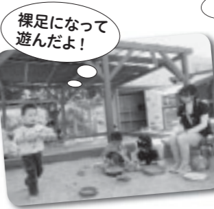
裸足になって遊んだよ!